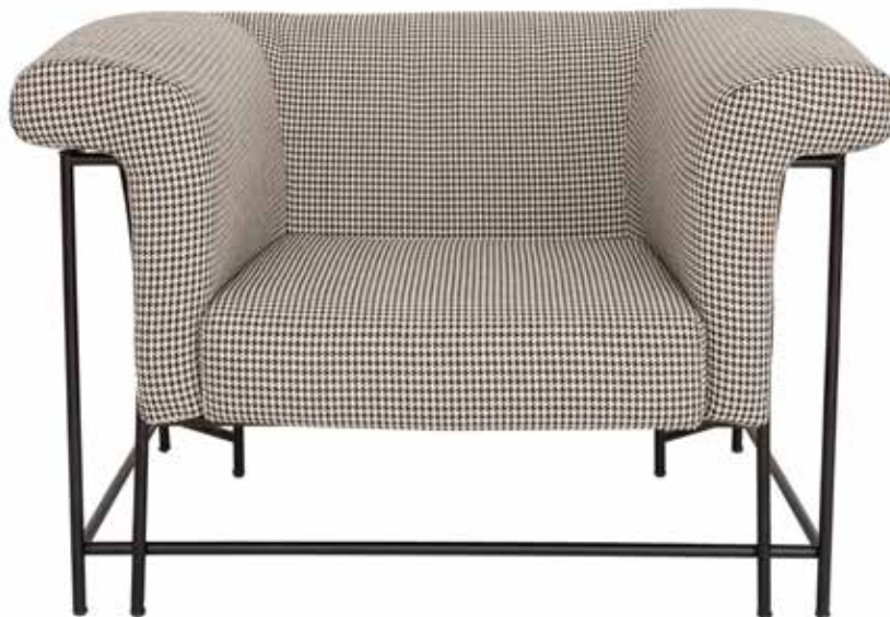
Poltrona Siglo XX