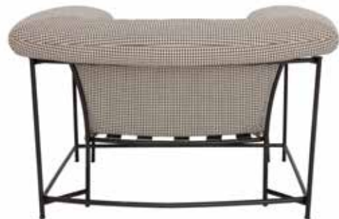
Poltrona Siglo XX