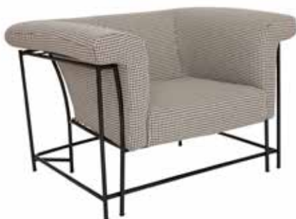
Poltrona Siglo XX