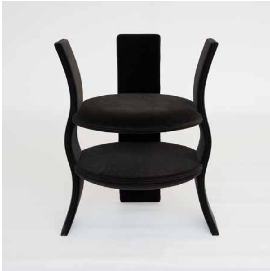
Dame Soft velluto