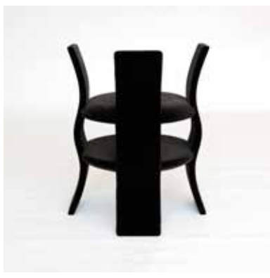
Dame Soft velluto