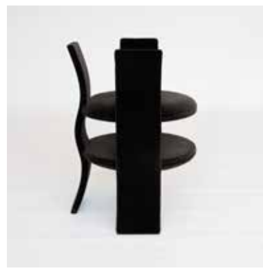
Dame Soft velluto