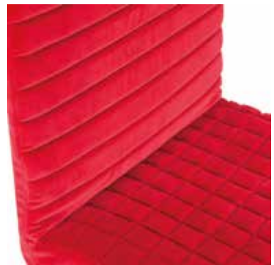
Tanit Soft red