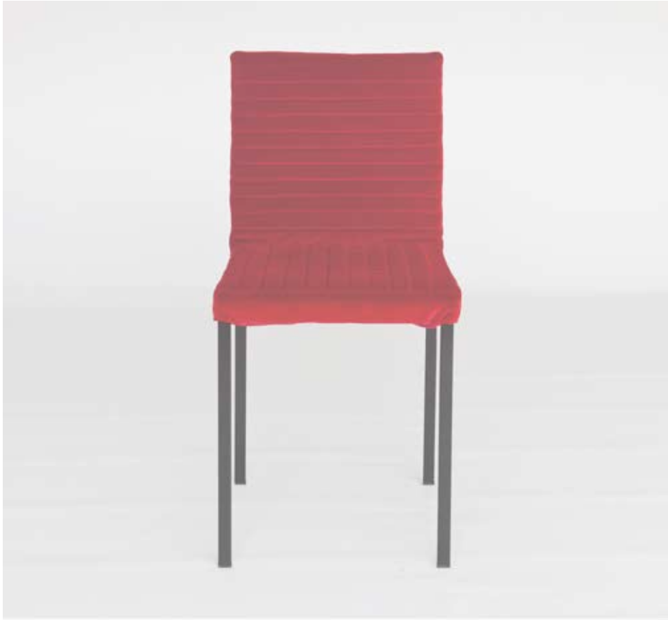
Tanit Soft red