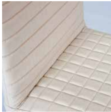
Tanit Soft white