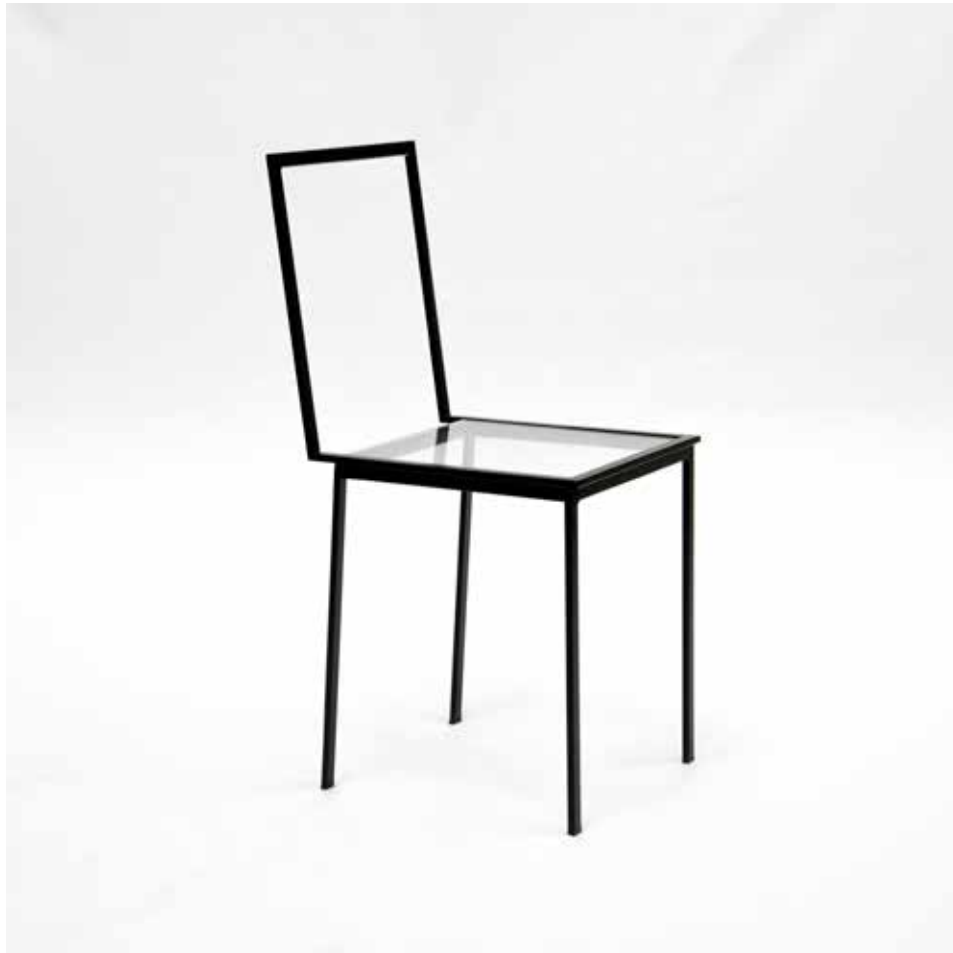
Tanit Skinny Plexi