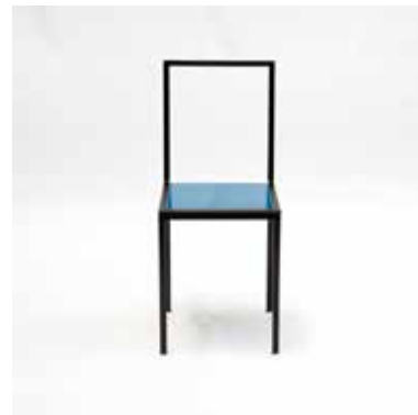
Tanit Skinny Smalto