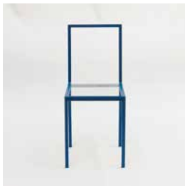
Tanit Skinny Colour